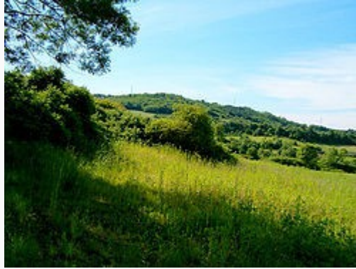
Природа око Врчина